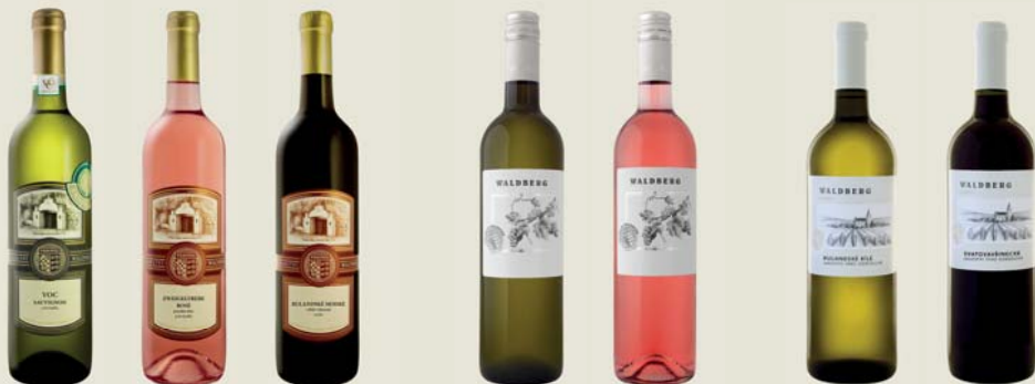
VOC ZNOJMO a TERROIR